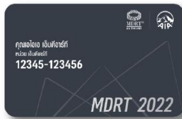
บัตรตัวจริง